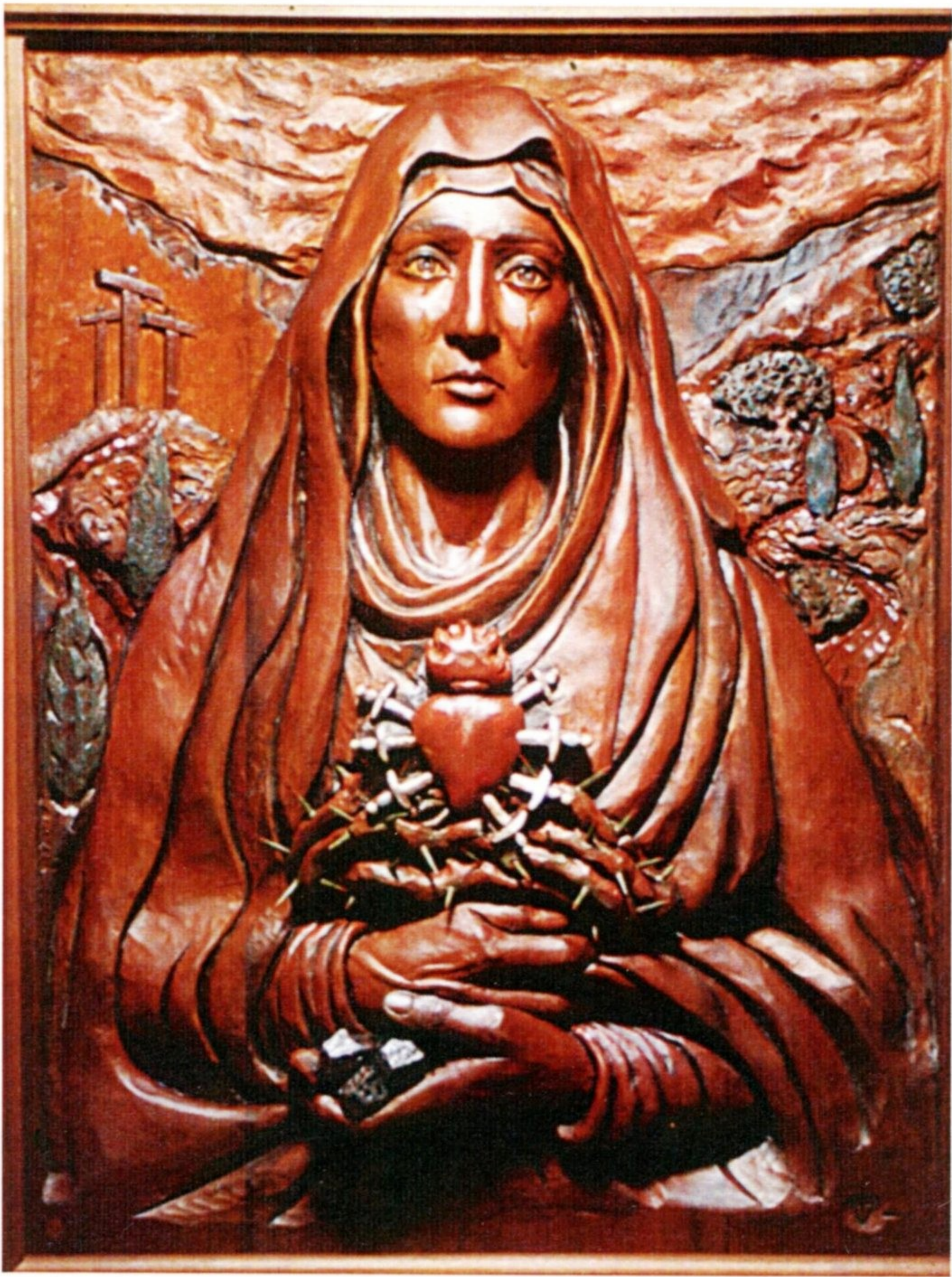
La Madre Dolorosa