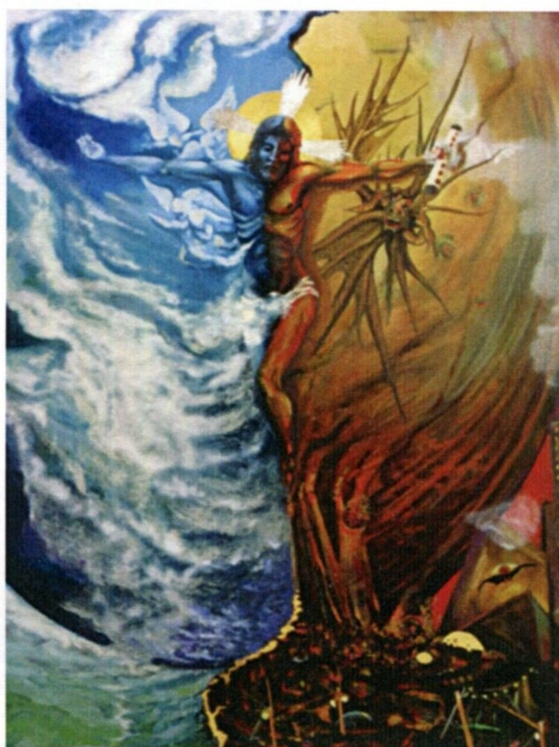
Hágase tu Volundad (detalle)