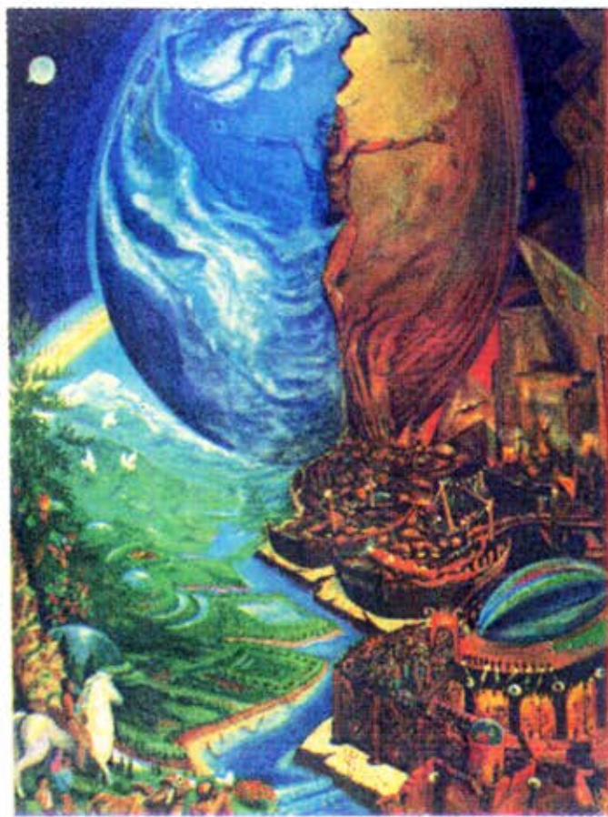
"Hágase tu voluntad", obra del pintor Vonn Hartung, que estará expuesta durante todo este mes en la Iglesia San Ignacio.

Cristo reconcilió a los humanos con Dios el Padre, unos con otros, comenzando la reconciliación del hombre con la