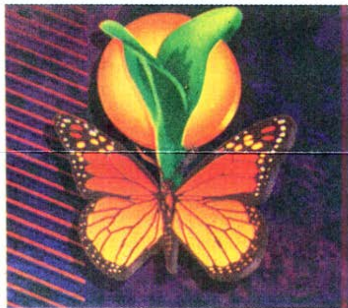
"El mundo era un paraíso; hermoso, intacto y de naturaleza armoniosa..."

¿Es ese el plan de Dios? ¿Es ese el plan de nosotros?